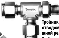
Тройник с боковым отводом с наружной резьбой Трубка на цилиндрическую резьбу SAE/MS

4. Зафиксировав контактную площадку для ключа придерживающим гаечным ключом, затяните стопорную гайку до тех пор, пока шайба не окажется напротив торца прилива.