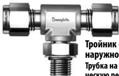
Тройник с отводом с наружной резьбой Трубка на цилиндрическую резьбу SAE/MS

Swagelok, VCO являются торговыми марками компании Swagelok Company