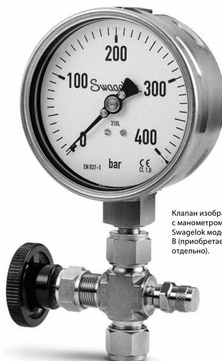
Клапан изображен с манометром Swagelok модели В (приобретается отдельно).