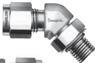
45°おすエルボー チューブ SAE/MS 平行ねじ