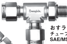
おすラン・ティー チューブ SAE/MS 平行ねじ