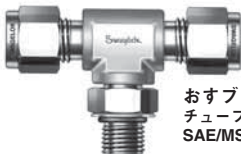
おすブランチ・ティー チューブ SAE/MS 平行ねじ

この日本語版取り扱い説明書は、英語版取り扱い説明書の内容を忠実に反映することを目的に、製作いたしました。日本語版の内容に英語版との相違が生じないように、細心の注意を払っておりますが、万が一相違が生じた場合には、英語版の内容が優先されますので、ご注意ください。