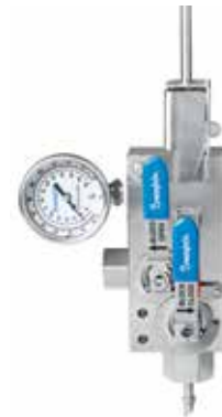
Sonda de Toma de Muestras (SPM)