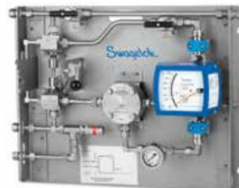
Módulo de Lazo Rápido (FLM)