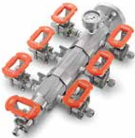
Bloque distribuidor (FDH)

Minimice el espacio y simplifique el diseño del sistema con nuestra serie de subsistemas prediseñados y preensamblados, fáciles de instalar y operar, para utilizar en cualquier tipo de planta e instalación donde se procesen fluidos.