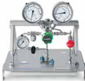
Estación de Preacondicionamiento (FSM)