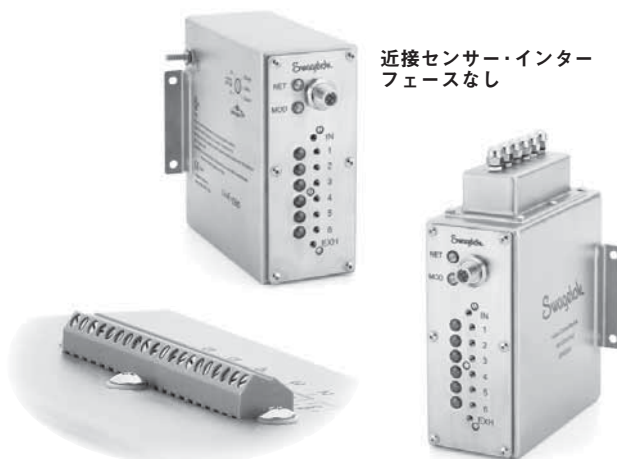
近接センサー・インターフェースなし